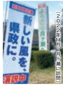
(2022年11月 月ヶ瀬に訪問)