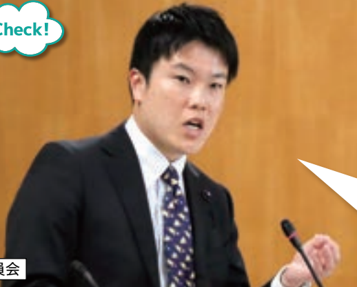
12月11日:総務警察委員会