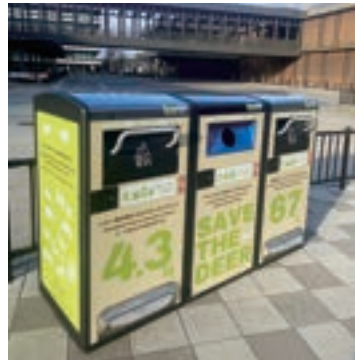
奈良公園バスターミナル近く

旧奈良高校の敷地に横たわったままの仮設体育館・通称“かまぼこ体育館”は、令和2年6月に2億3472万円の費用で設置されました。木造1階・約750平方メートルの敷地面積に県産木材がふんだんに使われていて、かつてはバスケやバドミントン、それにバレーボールの練習場として利用されていました。しかし、奈良高校が移転した後、令和4年4月から現在まで3年近くにわたってほとんど活用されていません。税金の有効活用という観点からも、その活用方法を早期に検討すべきではないでしょうか。近隣の中高生や雨の日の部活動等、活用のニーズも捉えながら教育委員会と連携をして対応を進めるべきです。