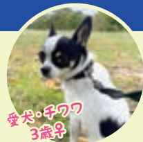
愛犬・子犬の 3歳半