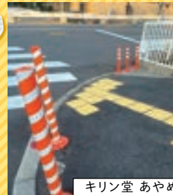
キリン堂 あやめ池店前の通学路

奈良市西大寺赤田町の通学路で、子どもたちが信号待ちする場所が車道に近く不安だというお声を頂戴しました。去年6月の大和中央道の部分開通で、西大寺北小学校への通学路が一部変更となり発生した課題でした。ドライバーから見ても車道と歩道の境がはっきりするよう、通常の2倍ほどの高さのポール等を設置していただきました。